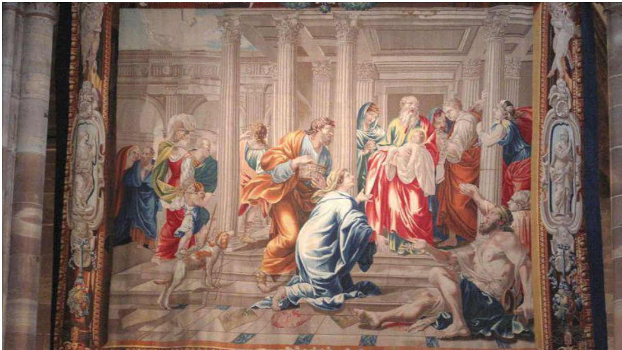
Tapiserie de la Purification de la Vierge dans la nef de la cathédrale de Strasbourg

Les crêpes, elles, par leur forme et leur couleur, annoncent le retour du soleil !