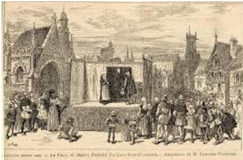
Théâtre du Moyen-Age prenant joué sur une place publique

Ils vont surtout raconter la vie des saints. Ces représentations, étant très longues, des farces étaient semées tout au long du spectacle pour que l'attention des spectateurs ne soit pas perdue.