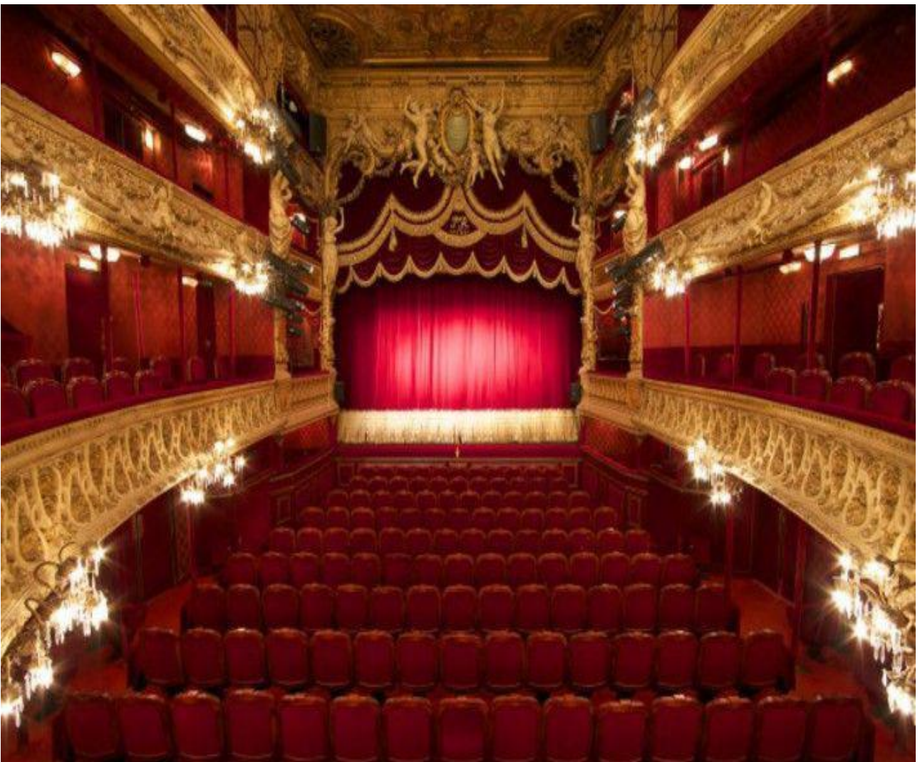
Théâtre du Palais Royal à Paris